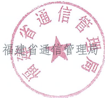
福建省通信管理局