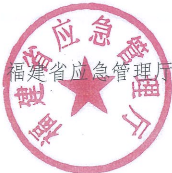
福建省应急管理厅