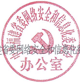
中共福建省委网络安全和信息化委员会办公室